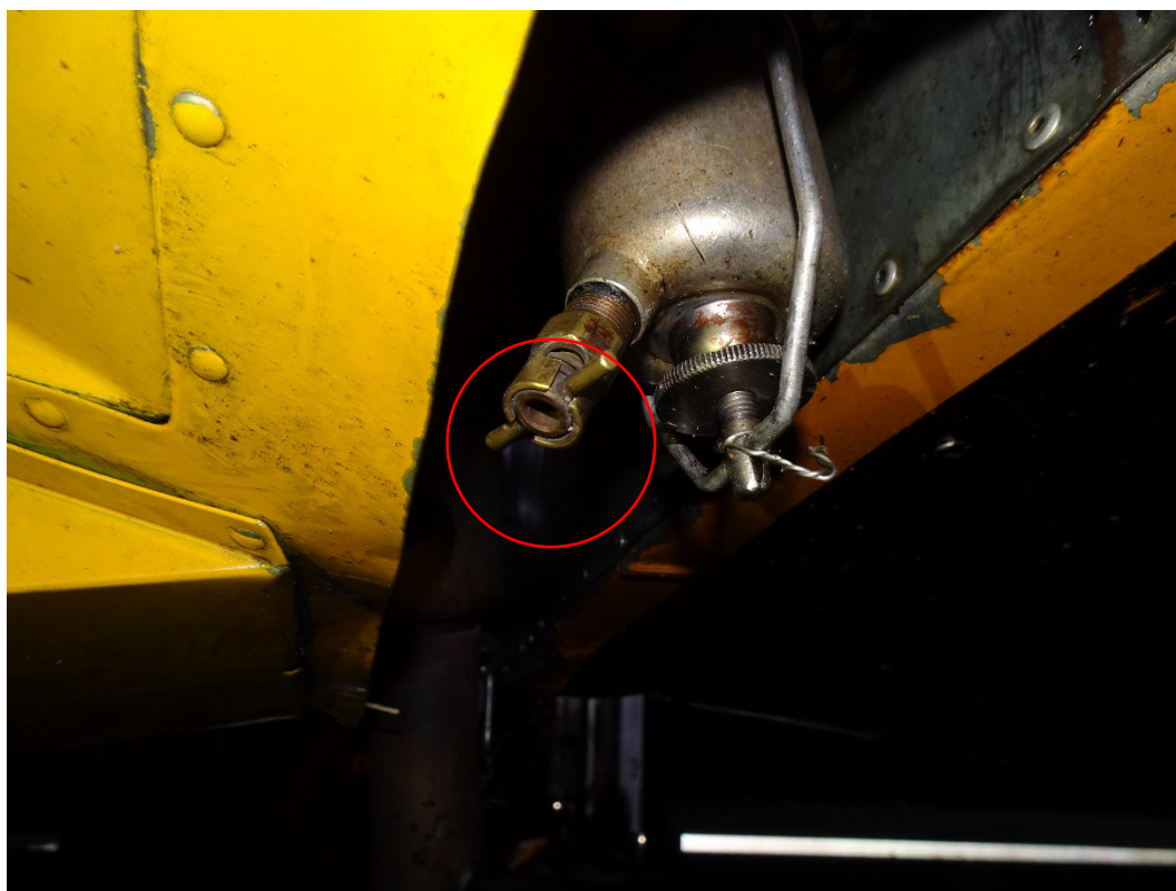
Figure 2 : Illustration de la purge (« Quick Drain Valve ») en position fermée (cercle rouge).

Un 1 er test complet selon les prescriptions du moteur a démontré un fonctionnement normal avec la purge « Quick Drain Valve » en position fermée (voir figure 2).